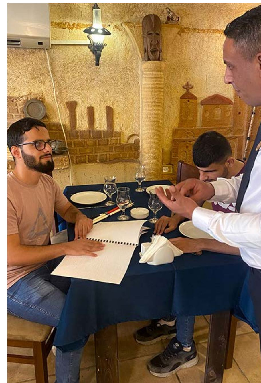
YMCA Peacemakers -nuorten aloitteen myötä näkövammaiset voivat nyt tilata itse ruokansa seitsemässä jeniniläisravintolassa.