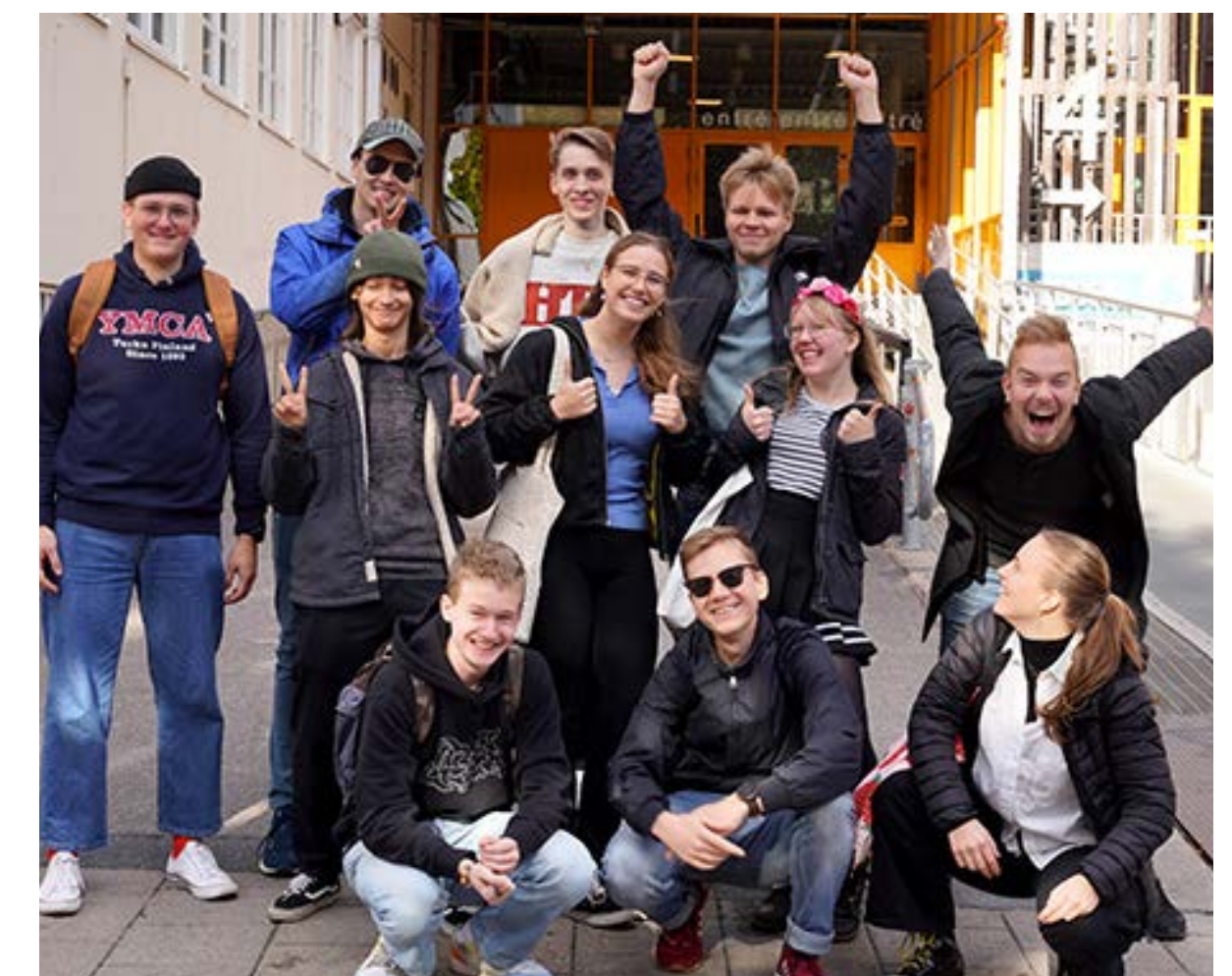
FINYMCA8-ryhmä Fryshuset-nuorisokeskukseen tutustumassa.