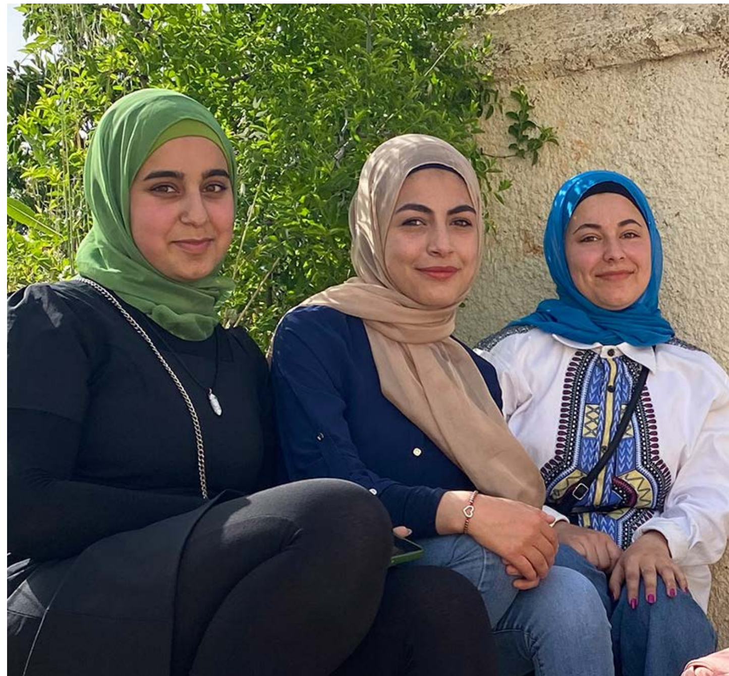
Libanonilaisia opiskelijoita.

Tutustu kehitysyhteistyöhömmme Palestiinassa.