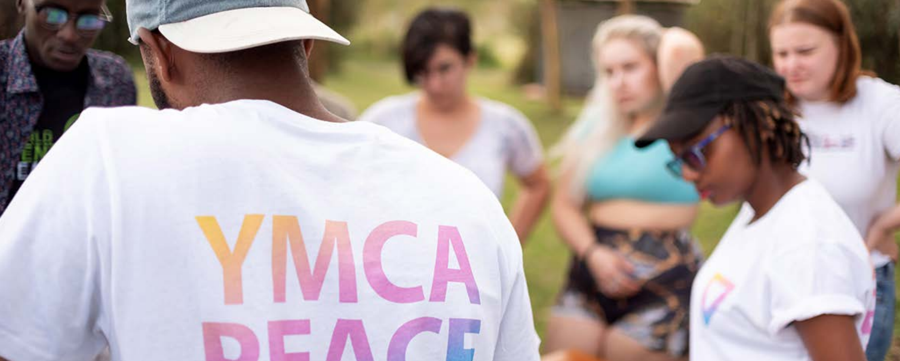
YMCA Peacemakers -nuoria Keniassa.