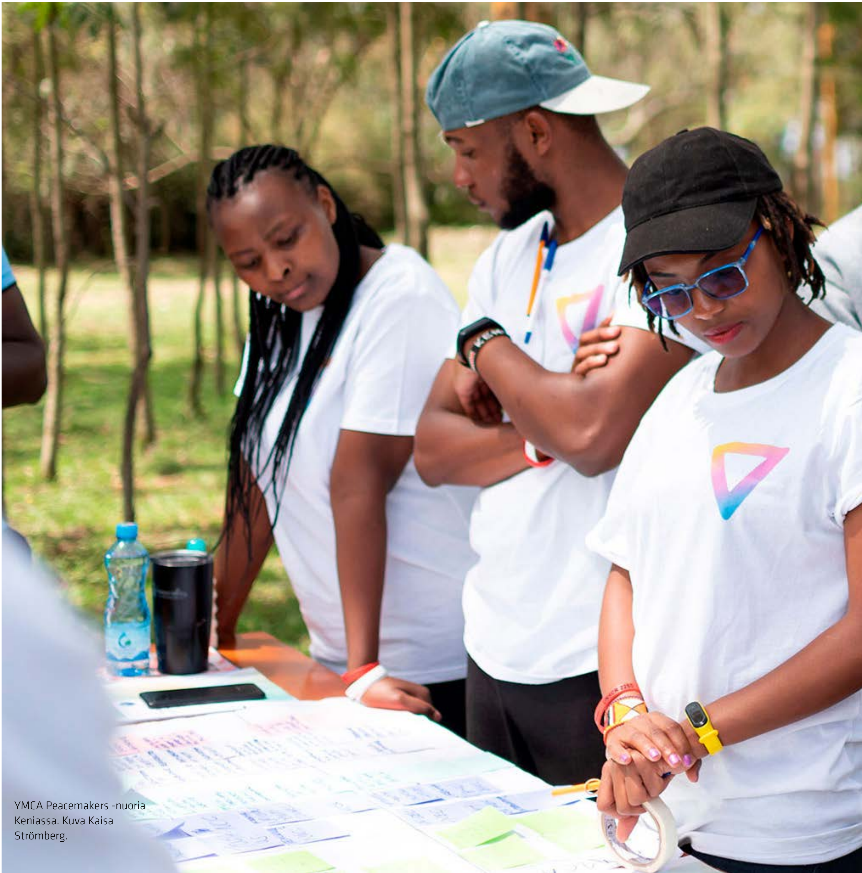
YMCA Peacemakers -nuoria Keniassa.